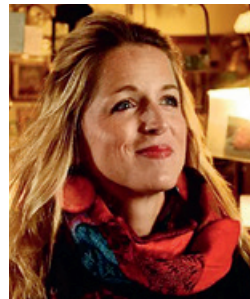
Sopranistin Lucy de Butts

Der Eintritt zu beiden Konzerten ist frei.